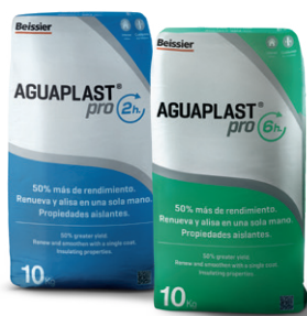
Saco 10 kg ref. 70476-001 Saco 10 kg ref. 70476-002

🕒 Sin límite ☀️ Repintado 24 h R 50 m 2 /L F Absorbentes