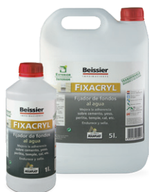
Botella 1 L ref. 70237-002 Garrafa 5 L ref. 70237-001