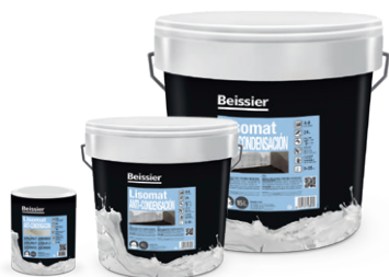
Tarro 750 ml ref. 70281-008 Cubo 4 L ref. 70281-001 Cubo 15 L ref. 70281-002