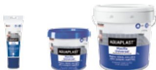
Tubo 200 ml ref. 70048-001 Tarro 1 kg ref. 70048-003 Cubo 5 kg ref. 70048-002

Masilla lista al uso para reparar, rehacer, unir y alisar... sobre cualquier material. Reparación de juntas de cerámicas. / Renovación directa sobre paredes con revestimiento cerámico, sin necesidad de eliminar las baldosas. Por su resistencia al agua y a la humedad ambiente su uso está especialmente recomendado en cuartos de baño, cabinas de ducha, cocinas... Color: Muy blanco. De uso interior y exterior.