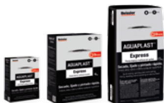
Estuche 1 kg ref. 70032-003 Estuche 4 kg ref. 70032-001 Saco 15 kg ref. 70032-002

Plaste polivalente de última generación de rápido secado para reparar y pintar en el mismo día: lijable y seco en 3 horas. Extraordinaria adherencia sobre cualquier material: cerámica, cristal, metal... Gran capacidad de relleno: espesores de hasta 50 mm de una sola vez, sin merma. Utilizable fresco sobre fresco: permite una segunda aplicación sin que la primera haya secado. Secado rápido. No merma en el espesor recomendado. Color: Blanco. De uso interior.