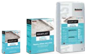
Estuche 1 kg ref. 70071-001 Estuche 5 kg ref. 70071-003 Saco 15 kg ref. 70071-002

Plaste en polvo. Reparación y reconstrucción de elementos y volúmenes decorativos, esculturas, cornisas, ángulos sin encofrado, vienteaguas... Renovación directa sobre paredes con revestimiento cerámico, sin necesidad de eliminar las baldosas. Adhesivo: un materiales de distinta naturaleza y/o grado de absorción. Resistente al agua y a la humedad ambiente (no aplicable en soportes sometidos a humedad permanente). Aplicable en cualquier espesor en una sola mano. No merma ni fisura. Moldeable y recortable fácilmente, en fresco. Color: Blanco. De uso interior y exterior.