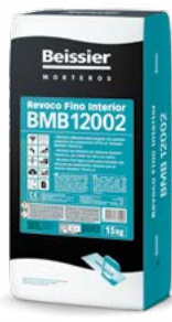
REVOCO FINO INTERIOR BMB12002