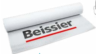
MALLA BEISSIER DE 160 gr/m 2

El Sistema de Aislamiento Térmico por el Interior Beissier Therm In ofrece una solución completa y optimizada de aislamiento de la vivienda. Con ventajas que hacen de este sistema una opción idónea cuando el SATE no es una alternativa viable.