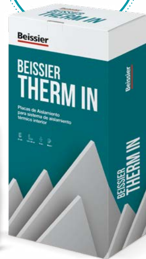
PLACAS DE AISLAMIENTO BEISSIER THERM IN