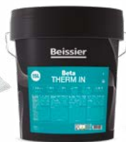
REVESTIMIENTO TERMOAISLANTE BETA THERM IN