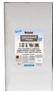
PRESENTACIÓN 5 l Ref.: 34030-001

Para consolidar y endurecer: Piedra natural, piedra artificial y otros soportes porosos.